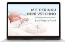
WEBINÁŘ „Mít peřinku není všechno“

„Možná vás to překvapí, ale i na tak přirozenou věc, jako je péče o dítě, je důležité se dobře připravit“.