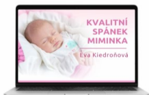
WEBINÁŘ „Kvalitní spánek miminka“