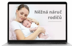
VIDEOKURZ „Něžná náruč rodičů“