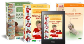
KNIHY A E-KNIHY „Něžná náruč rodičů“, „Rozvíjej se, děťátko“ a „Jak se rodí vodníčci“.